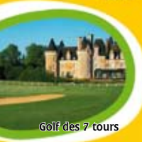
Golf des 7 tours