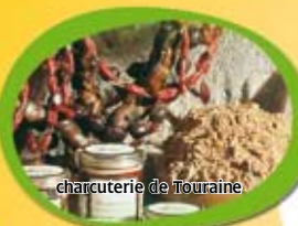
charcuterie de Touraine