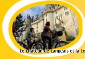
Le Château de Langeais et la Loire à vélo