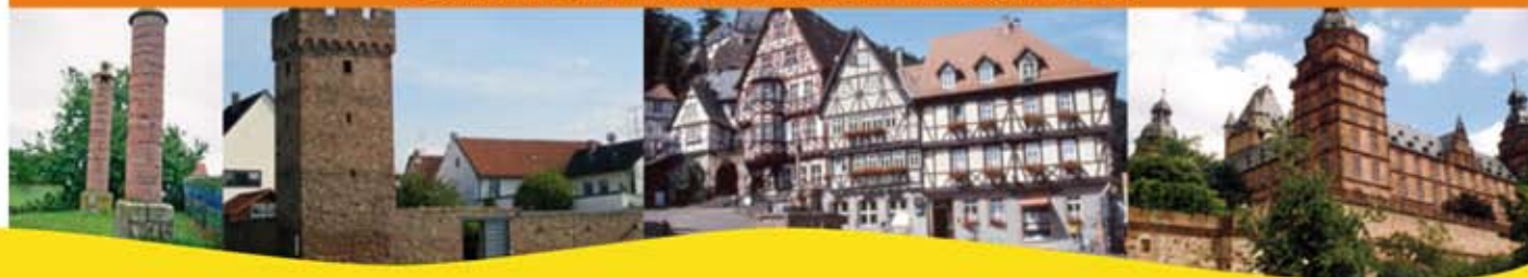
Galgenhügel Wörth a. Main - Stadtmauer Wörth a. Main - Miltenberg - Aschaffenburg

Viele weitere Sehenswürdigkeiten / Attraktionen erhalten Sie auf Nachfrage bei uns.